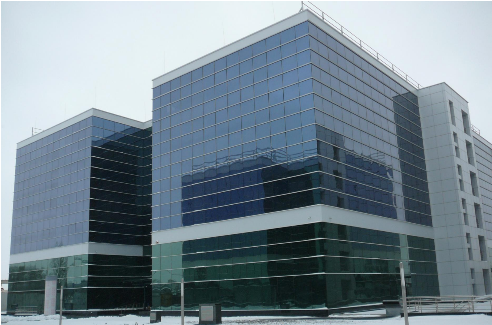
Centru pentru sprijinirea afacerilor „WEST GATE BUSINESS CENTER“