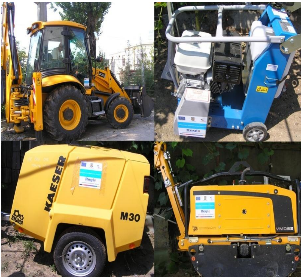
Tenta Cons SRL